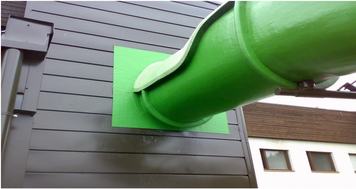
Kuva: Vesiliukumäki, joka kulkee sekä sisällä että ulkona, Hotelli Kuntoranta, Varkaus