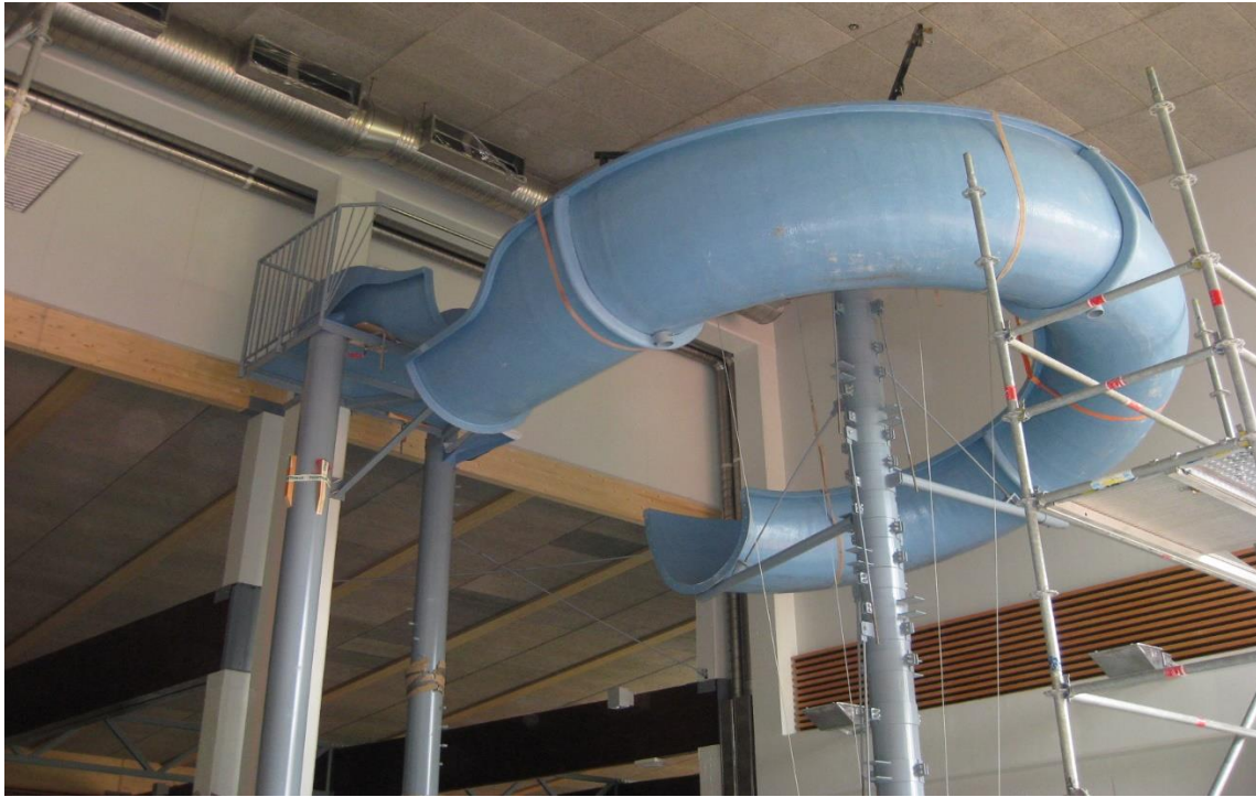
Kuva: Liukumäen asennus, Keuruun uimahalli

Liukumäki ja sen rakenteet tuetaan kaarteiden keskuspilareilla sekä kourun alapuolisilla pilareilla. Teräksiset tukirakenteet ovat kuumasinkittyä epoksimaalattua terästä. Tukirakenteiden väri voidaan valita RAL Classic – värikartan mukaan.