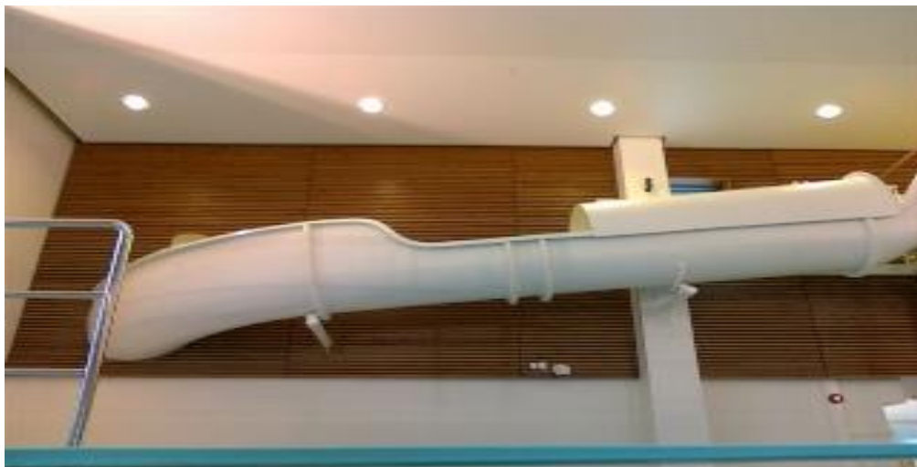
Kuva: Porin uimahalli

Malliston muunneltavuus mahdollistaa vesiliukumäkien sijoittamisen sekä sisätiloihin että ulkotiloihin. Myös liukumäen väri on muunneltavissa. Käytämme valmistuksessa RAL Classic-värikartan värejä.