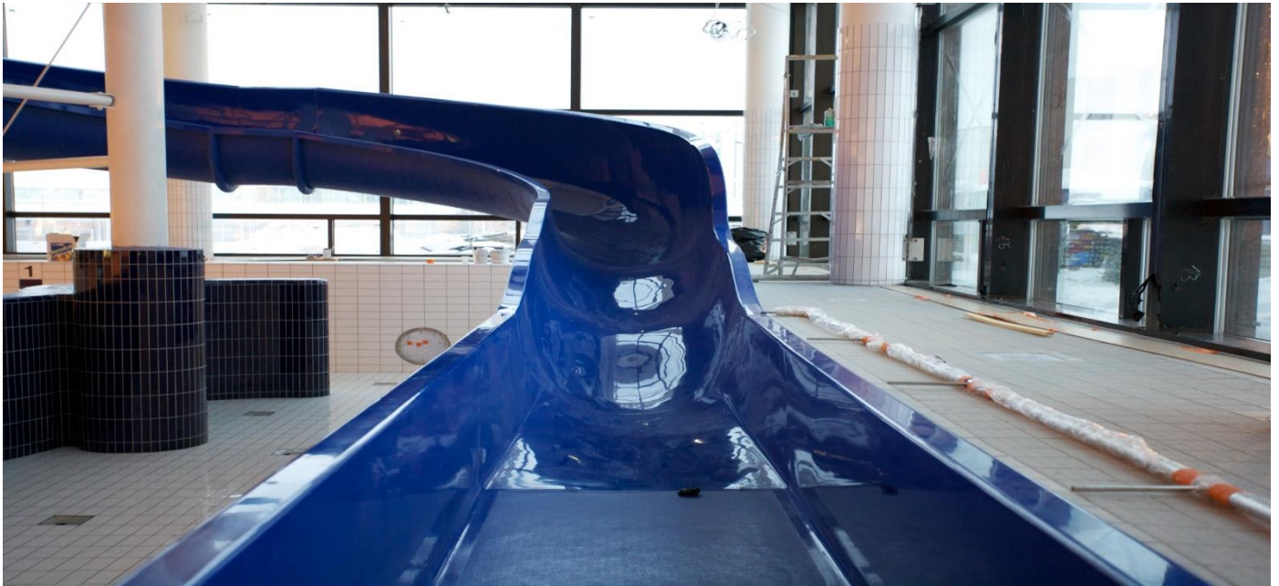
Kuva: Vuosaaren uimahalli

Blue Water -vesiliukumäki on Pointman Oy:n kehittämä vesiliukumäkimalli. Sen geometrian ansiosta tuotetta on mahdollistaa räätälöidä paremmin asiakkaan toiveiden mukaan.