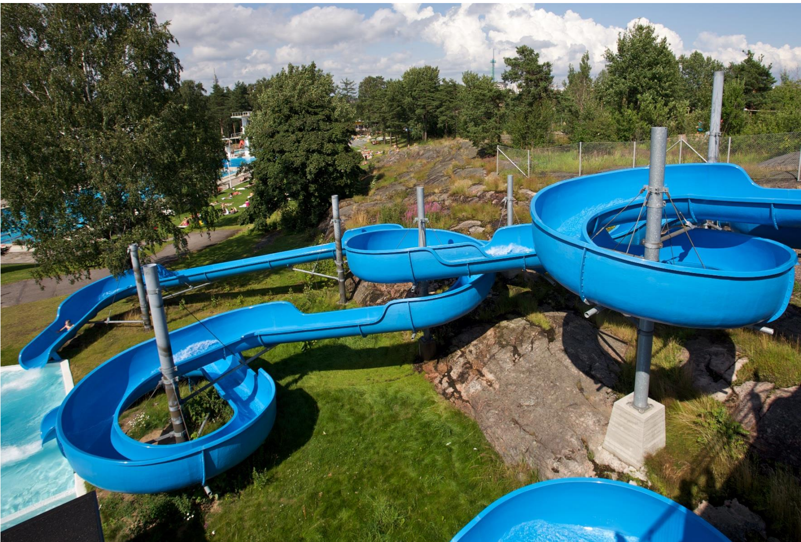
Kuva: Helsingin uimastadion