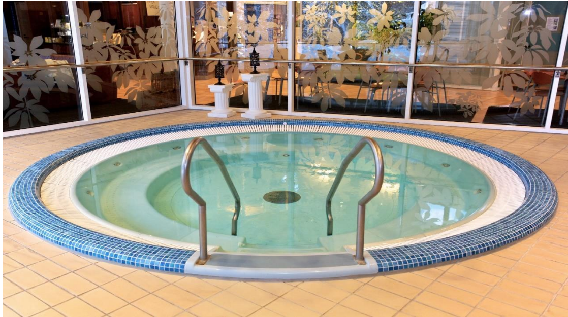
Kuva: Hyvinvointikartano Kaisankoti, Espoo

Pointman Oy valmistaa lasikuituvahvisteisesta lujitemuovista porealtaita sekä maa- että laivakohteisiin. Porealtaiden pintamateriaalina on laadukas gelcoat-pinta. Tarvittaessa altaan vedenpinnan yläpuolinen ulkoreunus voidaan pinnoittaa esimerkiksi mosaiikkilaatoilla.