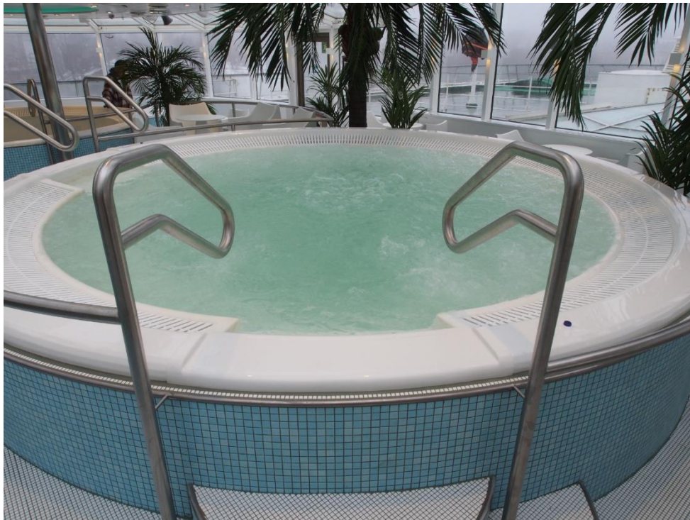
Kuva: Silja Serenade, Tallink Silja

Address Niinistökatu 14 05800 HYVINKÄÄ FINLAND